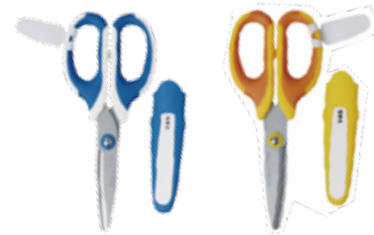
⑱はさみ(右利き用) ※⑱⑲どちらか ⑲はさみ(左利き用) ※手のサイズに合わせたものをご使用ください。

⑯筆拭きタオル(2枚) ※絵の具拭き用と道具拭き用に2枚必要です。 ※教室での販売がございません。ご家庭でご用意下さい。